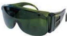
2 x gogle ochronne