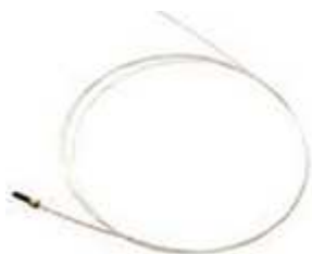
2 x światłowód