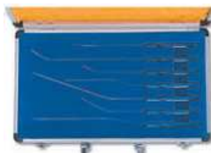
zestaw rękojeści otolaryngologicznych