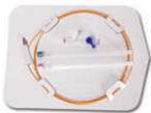
osłony zestaw do PLDD